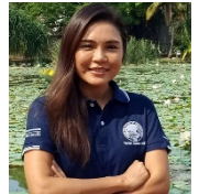
TS Carraway (AIT, Thailand)