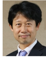
F Yokota Organizer (Kyushu Univ)