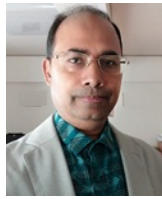
RI Maruf Session MC (Kyushu Univ)