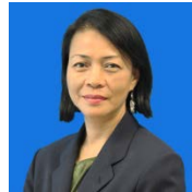
HB Lasimbang (UMS, Malaysia)